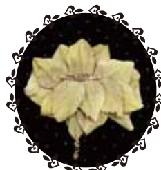
クラウンブローチ <7.5×8>