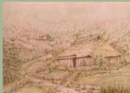
※額付 額サイズ<31×40 (太子)>