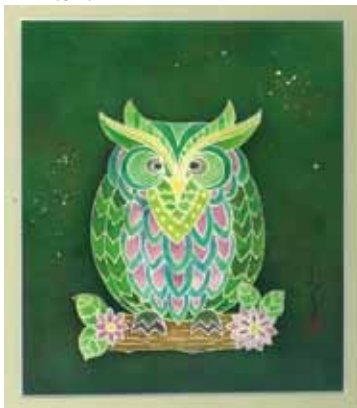
※額付 八つ切り額 マット窓<19.3×16.7>