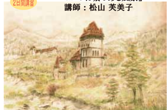
※額付 額サイズ<31×40 (太子)>