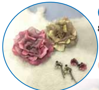
ブローチ<Φ8.5> イヤリング<Φ1.5>