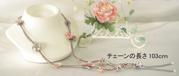
<花Φ8> スタンドサイズ <25×20×18>