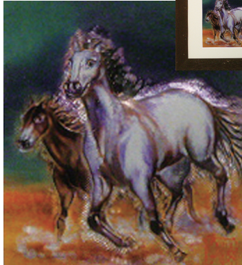
額サイズ<20×20> 革サイズ<14×12>